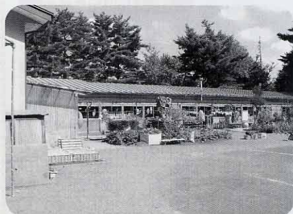
老朽化している現在の広丘東保育園

明細を提出いただけない家庭について調査する。自営や農業については、別の証明を出していただくことにしている。 問 入所要件を満たしていないと思われる家庭を個別に選考会議が調査するのが筋だ。全家庭にネットを掛け調査することは、子育て世帯に無用なマイナスイメージを与えてしまう。給与明細を提出しない家庭に、退園届を出すように「指導」とあるが、本来は自主的に出すものであり、「指導」するものではない。意図的な保育解除処分でなく、自主退園とし、行政訴訟逃れではないか。(中村) 答 退園届は入所要件を満たさなくなったことを確認するために提出していただく。