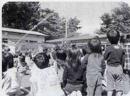
保育行政は子育て支援の大きな柱

答 市長への手紙等で入所要件を満たしていない子どもが通園しているといった意見があり、昨年の入園説明会で1カ月分の給与支払い明細の提出をお願いした。入所要件等については条例で定めているので、規則を例規集に載せる必要はない。選考会議は給与