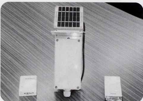
地域児童見守りシステム（試作品）