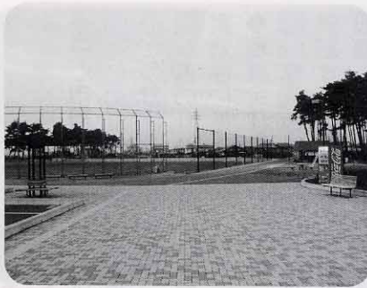
市内に27箇所ある都市公園 (塩尻北部公園：広丘原新田)

説明もありました。平成19年度一般会計補正予算案については、委員から丘駅周辺整備事業や道路新設改良事業などに関して質疑があり、これに対して、広丘駅用地取得費の増額について、東口広場の用地を土地開発公社から取得して来年度からの整備工事に備えたいなどの答弁がありました。