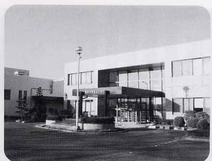
手数料の見直しにより、衛生センター 施設利用手数料も改正された。

る旨意見が出されました。一般職の職員の給与に関する条例の一部を改正する条例は、人事院勧告に基づき給料の改定をするものです。継続審査の請願1件は趣旨採択、議員提出議案は可決、陳情4件は採択、1件は不採択となりました。今後も、市民サービス向上に向け委員会として取り組んで参ります。