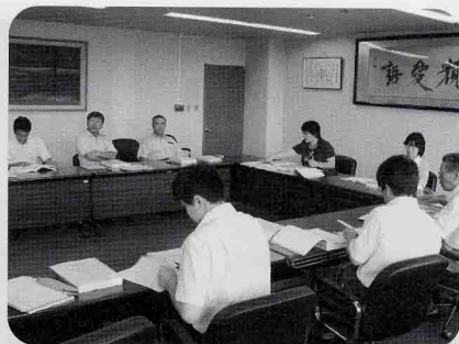
各決算案件は、常任委員会の担当ごとに分けられ審査した。