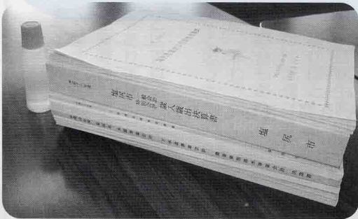
9月定例会に提出された議案、決算書など。その厚さは8cmになる。