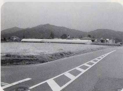
(仮称)ふれあいセンター・洗馬児童館建設予定地(洗馬芦ノ田)

近年多発している異常気象による災害への対策強化・拡充と、原因とされる地球温暖化の防止策について、積極的な推進を国に対し求めるため、関係各省に対する意見書の提出を求めるもの。