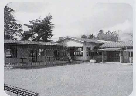
塩尻市北部子育て支援センター