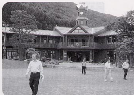
6月定例会中に全議員が視察した 賛川小学校