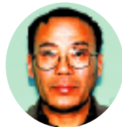
区 区 区 武 武 武 江 江 江 吉 吉 吉

市政の昨年の大きな案件は榑川村との合併と市街地活性化策の策定であるといわれたが、一人の職員の不祥事でそれも霞んでしまった感がある。市政の仕組み（教育・組織）に問題はなかったか？