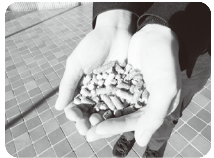
さわれる燃料 ペレット

した。市全体の経済の活性化を図るためにも、対象業種を広げること検討することを要望し、この件に関して当委員会に経過及び状況報告を求めることとしました。