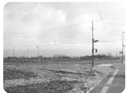
西側から予定地を撮影