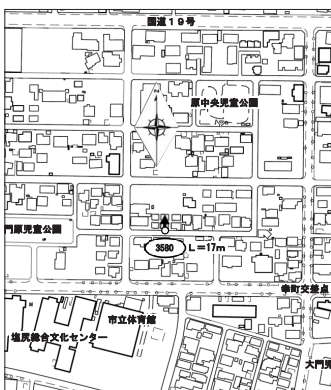
認定する路線(3580号線)