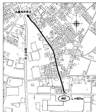
廃止する路線(4021号線)