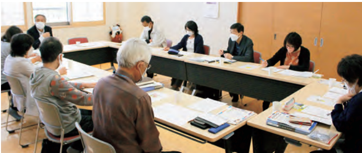
定期的に地区ごとの民生委員・児童委員で集まり、情報交換を行いながら、地域住民の支援に尽力しています。

民生委員・児童委員は、こうした悩みや不安を解消するために、相談者を行政や福祉団体などへつなぐ役割を担っています。次のページでは、現役の委員のやりがいなどを紹介します。