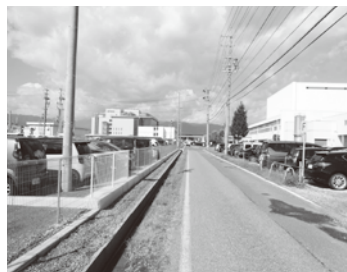
八幡池東線の拡幅改良予定場所

答 整備を決定している施設は、広丘地区の法人が、同地区内に地域密着型の定員29人以下の特別養護老人ホーム1施設と、認知症グループホーム1ユニット定員9人を3ユニット整備する計画で、片丘地区内に2法人を選定したが、建設場所は現段階では未確定である。