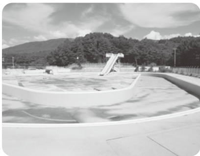
用途廃止した市民プール

答 第五次塩尻市総合計画の第2期中期戦略（平成30年度から32年度まで）において、公共施設の管理運営など検討を進めることになっている。提案の公共施設管理公社の設置や管理体制については、検討課題としていく。