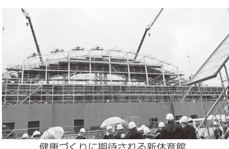
健康づくりに期待される新体育館