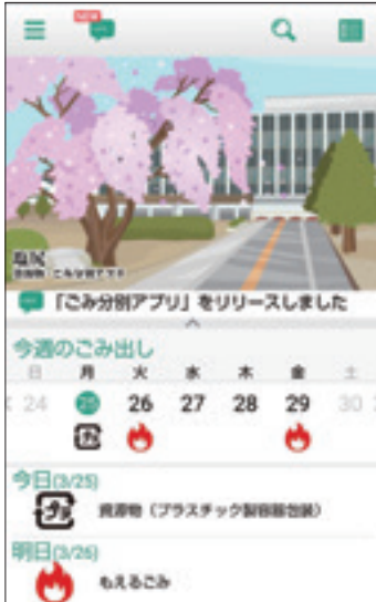
アプリ画面イメージ図

また、分別方法や収集日程は「塩尻資源物・ごみ分別アプリ」からも確認することができます。