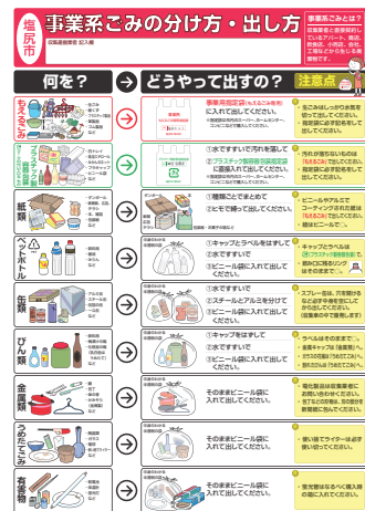
事業系ごみの分け方・出し方

なお、収集品目や日程、収集場所に関しては、「事業系のごみの分け方・出し方」をご参考のうえ、管理会社または大家にご確認ください。