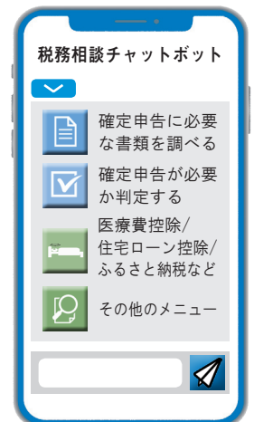
AIチャットボットのイメージ