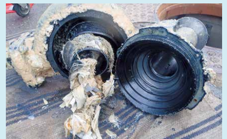
下水道ポンプの故障により、ポンプを分解した時の写真