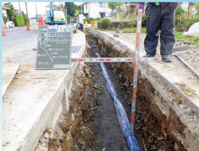
水道管耐震化工事の様子