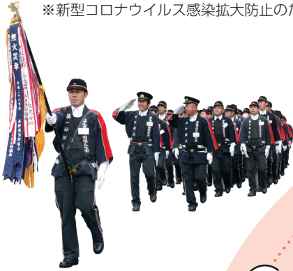
塩尻市消防出初式