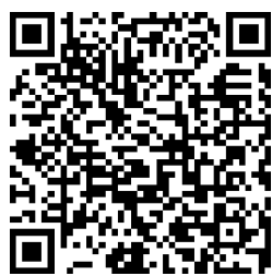
▲請願・陳情について