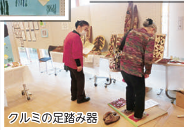
クルミの足踏み器