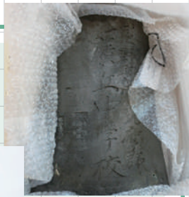
廣丘中学校 ▶ (現・丘中学校)