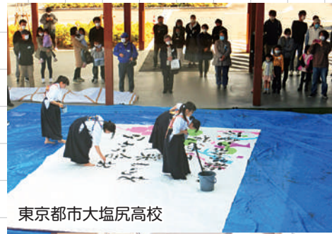
東京都市大塩尻高校