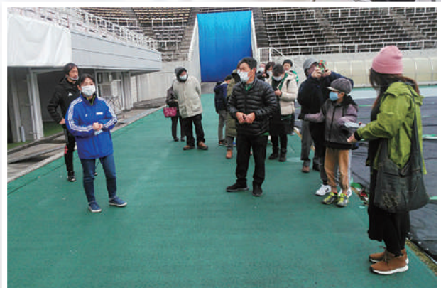
1月17日に開催した 「松本山雅新春ウォーキング」

広丘公民館の最新情報は Facebookページをご覧ください。 https://www.facebook.com/hirookakouminkan