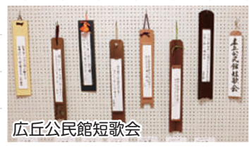
広丘公民館短歌会