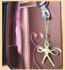
▲ランドセルにリボンをつけて登下校

「エクト」の取り組みに賛同した広丘小の奨善会でも差別や偏見を生まないと同時に思いやりの心を持つためにシトラスリボンプロジェクトに全校で取り組んでいます。