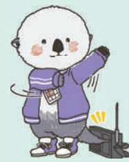
塩尻市健康推進キャラクター ラジッコ