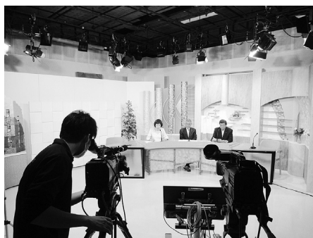
委員会レポート収録の様子