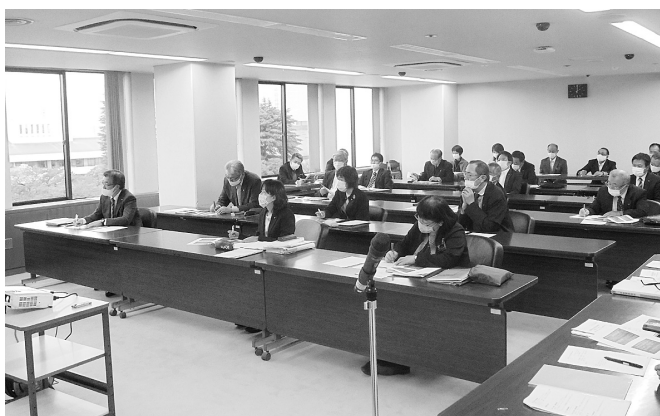
手話言語研修会の様子