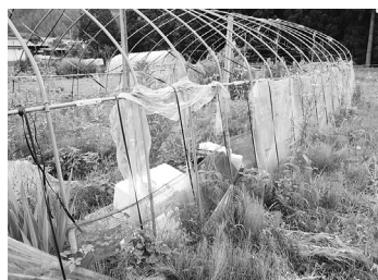
放置されたビニールハウス

問 せっかく大学に入学しても、在籍途中に授業料が納められなければすぐに除籍となる。奨学金や食料支援で日常生活はかろうじて持ちこたえても、高すぎる授業料を工面できない学生が少なからずいる。学資等を補助する制度はないか。 答 国の制度として、令和2年から高等教育就学支援制度が開始された。授業料減免と給付型奨学金をセットにしたもので、年2回の申込期間があるが、コロナで家計が急変した場合には随時受け付ける。在学する大学が窓口になっている。今年度に限り、緊急特別無利子貸与型奨学金制度もある。制度の利用による学びの継続を願っている。 (教育総務課)