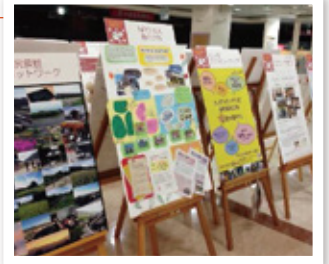
※塩尻市市民活動支援事業

今年の「しおじりまちづくり交流会2015」のテーマは「 つながって 広げる笑顔 」です！塩尻市内外で活動する団体や企業が、一堂に会して活動内容を知ったり、お互いに交流を深めたりする機会です。塩尻市のえんぱーくとウィングロード及びショッピングセンター・GAZAでは、 市民活動団体と企業が制作した「活動パネル」の展示 も実施します(2015年11月17日～12月8日)。ぜひお立ち寄りください☆