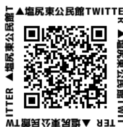
塩尻東公民館ツイッターQRコード

講座動画以外の情報は塩尻東公民館フェイスブックページから発信していますので、こちらもご覧下さい。