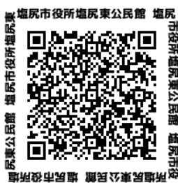
塩尻市役所ホームページQRコード