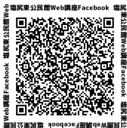
塩尻東公民館Web講座フェイスブックページQRコード