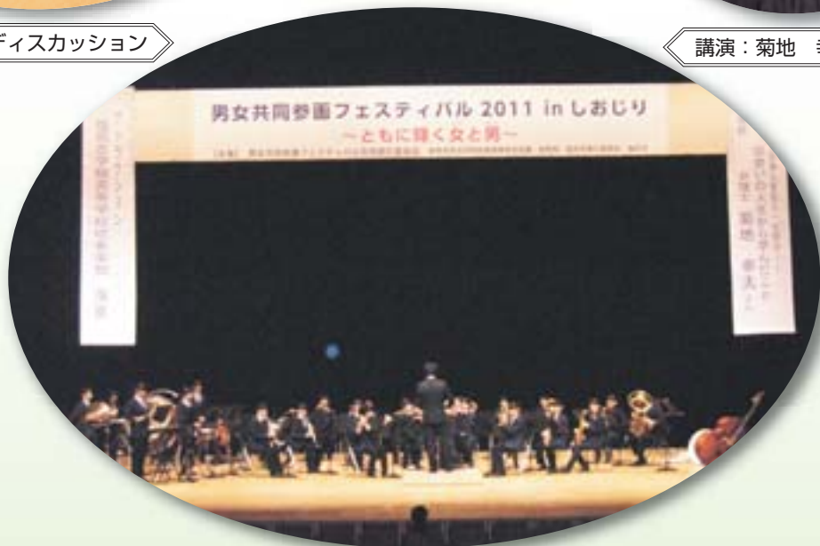
塩尻志学館高等学校吹奏楽部 アトラクション

10月22日(土)「男女共同参画フェスティバル2011 in しおじり」を開催！！