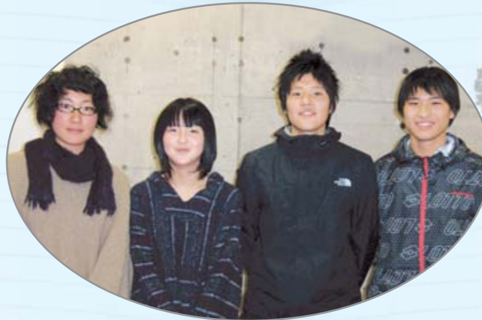
塩尻志学館高等学校 2学年 (左から)