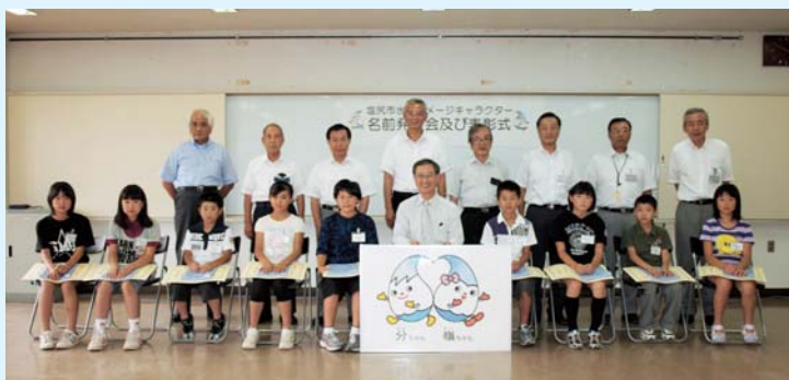
名前発表会及び表彰式 (平成22年7月28日)

利用者みなさまに、水道事業により親しみを感じていただくため、水道イメージキャラクターをデザインしました。