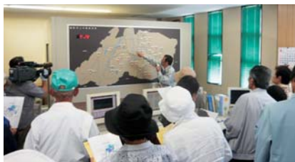
床尾浄水場 中央集中監視施設