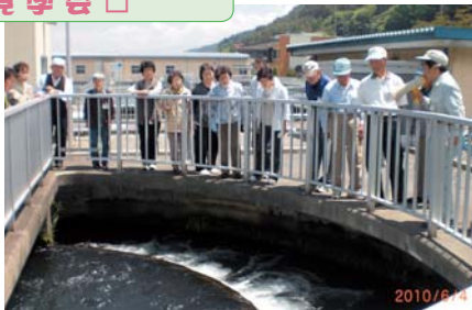
松塩水道用水管理事務所 本山浄水場着水井