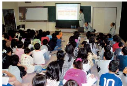
▲吉田小学校4年生対象とした出前講座(平成22年5月24日)