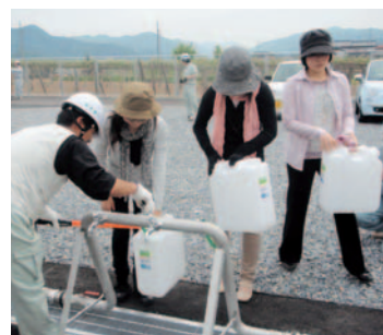
▲災害時には、応急給水拠点でも飲料水を提供します。