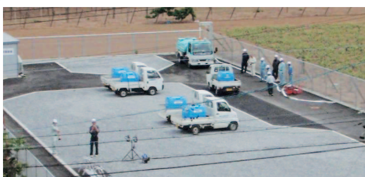
▲完成した「郷原配水池 応急給水拠点」にて、塩尻市水道事業協同組合と合同で、応急給水活動の訓練を行いました。 (平成24年5月24日)

応急給水拠点は、災害時の円滑な給水活動と地域バランスを考慮するなかで、今回整備した郷原配水池のほか、床尾受水池など市内6か所に整備を予定し、平成23年度には、市内1か所目となる「郷原配水池 応急給水拠点」が完成しました。