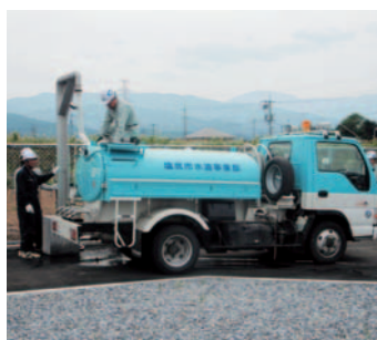
▲災害時に、一刻も早く市民の皆様へ飲料水を届けるために、給水車への補給訓練を行いました。