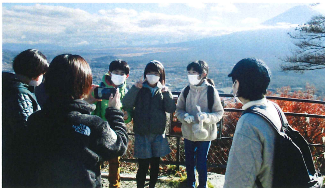
親子社会体験学習 11月25日(土) 山梨県