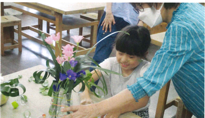
サマースクール公民館 8月2日(水) 総合文化センター