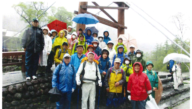
徳沢トレッキング(上高地) 5月19日(金)