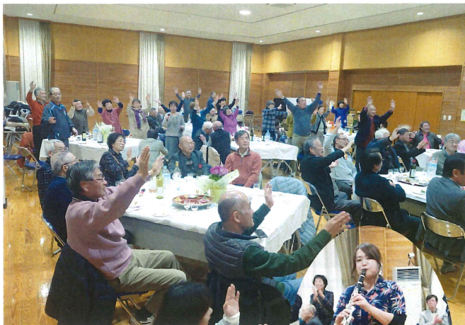
ワインと音楽の夕べ 1月13日(土)