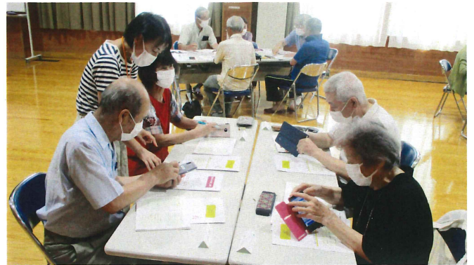
スマートフォン活用講座 9月1日(金) 開始 全4回