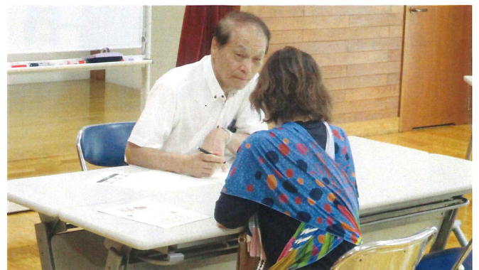
空き家対策啓発講座 9月2日(土)