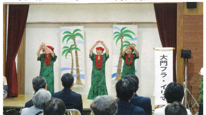
大門地区文化祭 11月11日(土)