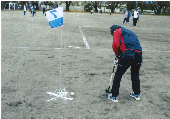
グラウンドゴルフ大会 11月12日(日) 塩尻西小学校グラウンド グラウンドゴルフ大会成績