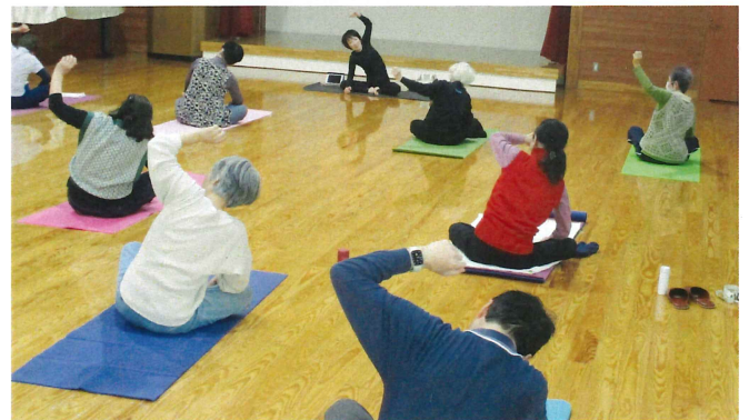
だいもん畑の健康講座 昼の部: 10月31日(火) 開始 全2回 夜の部: 10月30日(月) 開始 全2回