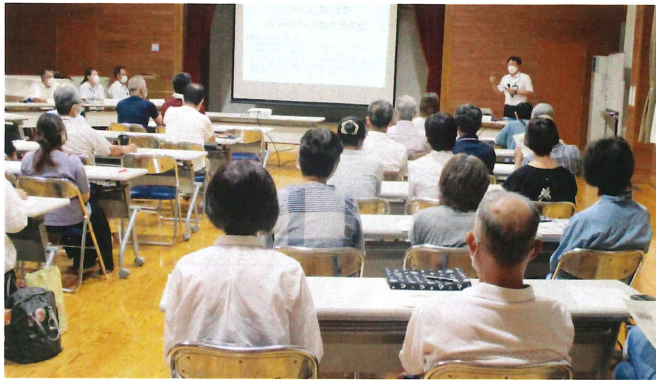
人権教育推進会議 7月24日(月)