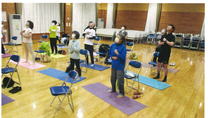
体幹バランスアップ教室 6月22日(木)開始 全3回