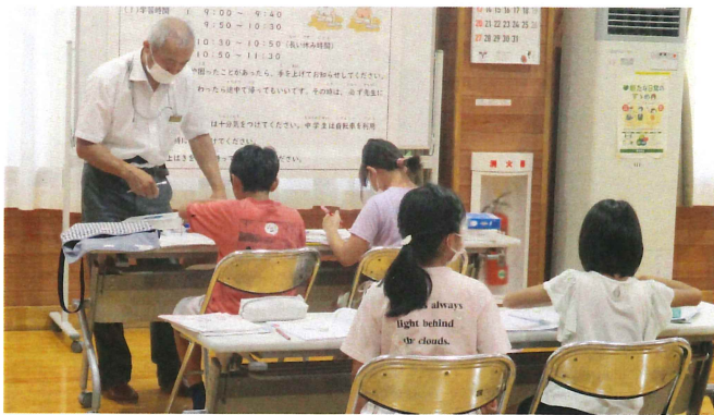
なつやすみ学習ひろば 7月27日(木)開始 全8回