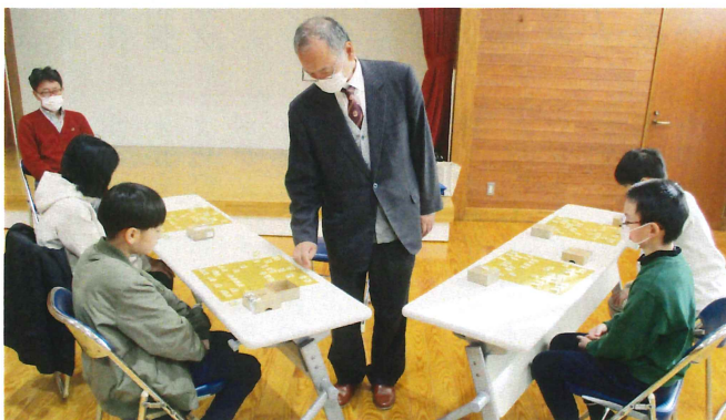
初心者向け将棋講座 12月9日(土) 開始 全2回