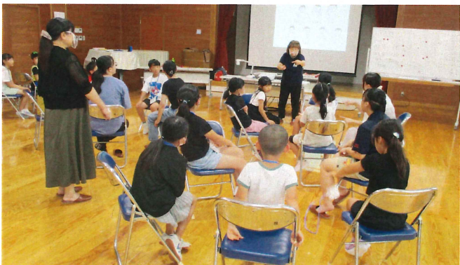
子どもふくし講座～手話をおぼえよう～ 7月28日(金)開始 全2回