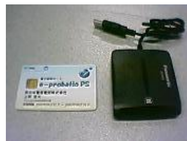
左 IC カード、右 IC カードリーダー